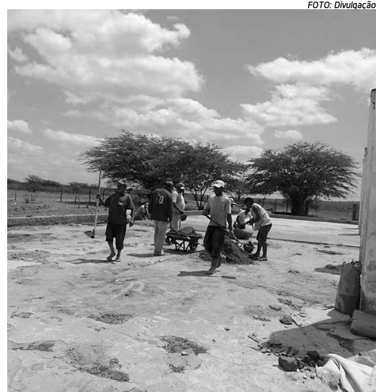
Moradores do assentamento Vitória trabalhando em mutirão

A Coonap trabalha com empresas federais, estaduais e municipais e tem um contrato com o Incra/PB para assessoria e assistência técnica em assentamentos da reforma agrária e com algumas prefeituras para a realização de cursos profissionalizantes para jovens e adultos. O sistema que será inaugurado hoje inclui a cisterna, que tem capacidade para aproximadamente 300 mil litros,