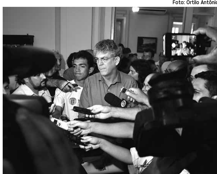
Governador diz que o momento é de trabalho e não de campanha

Ricardo afirmou que tem andado por todas as regiões da Paraíba e se impressiona com os depoimentos das pessoas sobre a administração do Estado. "Este final