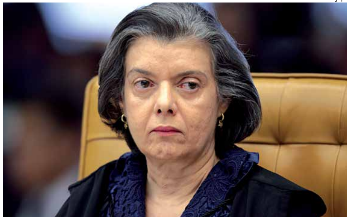
Ministra presidente do Tribunal Superior Eleitoral está de olho nos prazos e nos tribunais regionais

Nesse dia, também termina o prazo para que ocupantes de cargos públicos, como ministros de Estado, secretários, presidentes ou diretores de estatais e governadores interessados em concorrer às eleições deixem seus postos. A exceção é para os que buscam a reeleição - eles não precisam deixar o cargo.