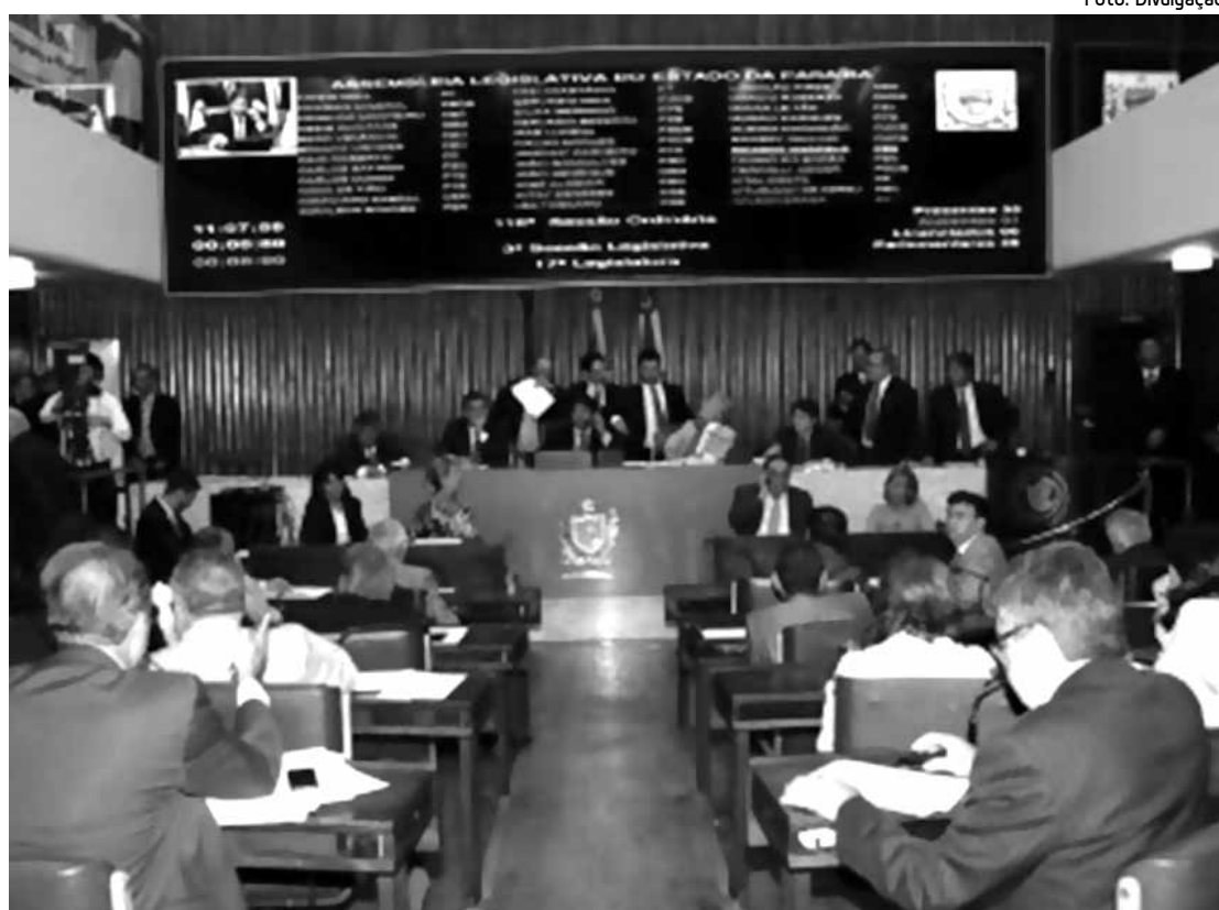
Na volta ao trabalho em plenário, quatro deputados titulares assumem no lugar dos suplentes

Daniella Ribeiro revelou ainda que teve o nome lembrado, mas que preferiu voltar a disputar uma cadeira na Assembleia Legislativa da Paraíba.