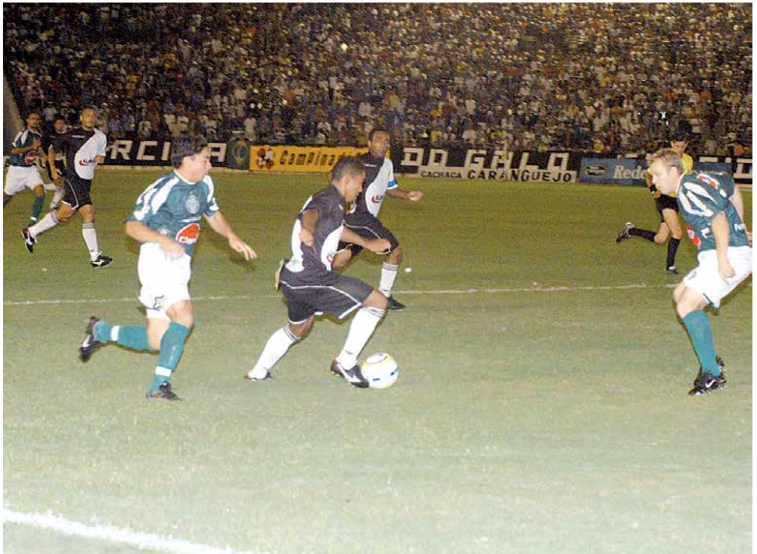
Em 2005, jogo contra o Coritiba no Amigão, vencido por 1 a 0. No Couto Pereira, o Galo perdeu por 2 a 1 e eliminou o time paraense

Após a Copa Nordeste, o Galo disputou apenas dois amistosos de preparação para a Copa do Brasil. A diretoria investiu pesado na preparação física, trocando o fisicultor e trazendo um fisiologista. Após vários testes feitos, ficou comprovado que o elenco vinha tropeçando nas próprias pernas, com um condicionamento físico de apenas 60 por cento do ideal para que o time rendesse bem. Com relação ao elenco, não houve muitas novidades desde a participação na Copa do Nordeste.