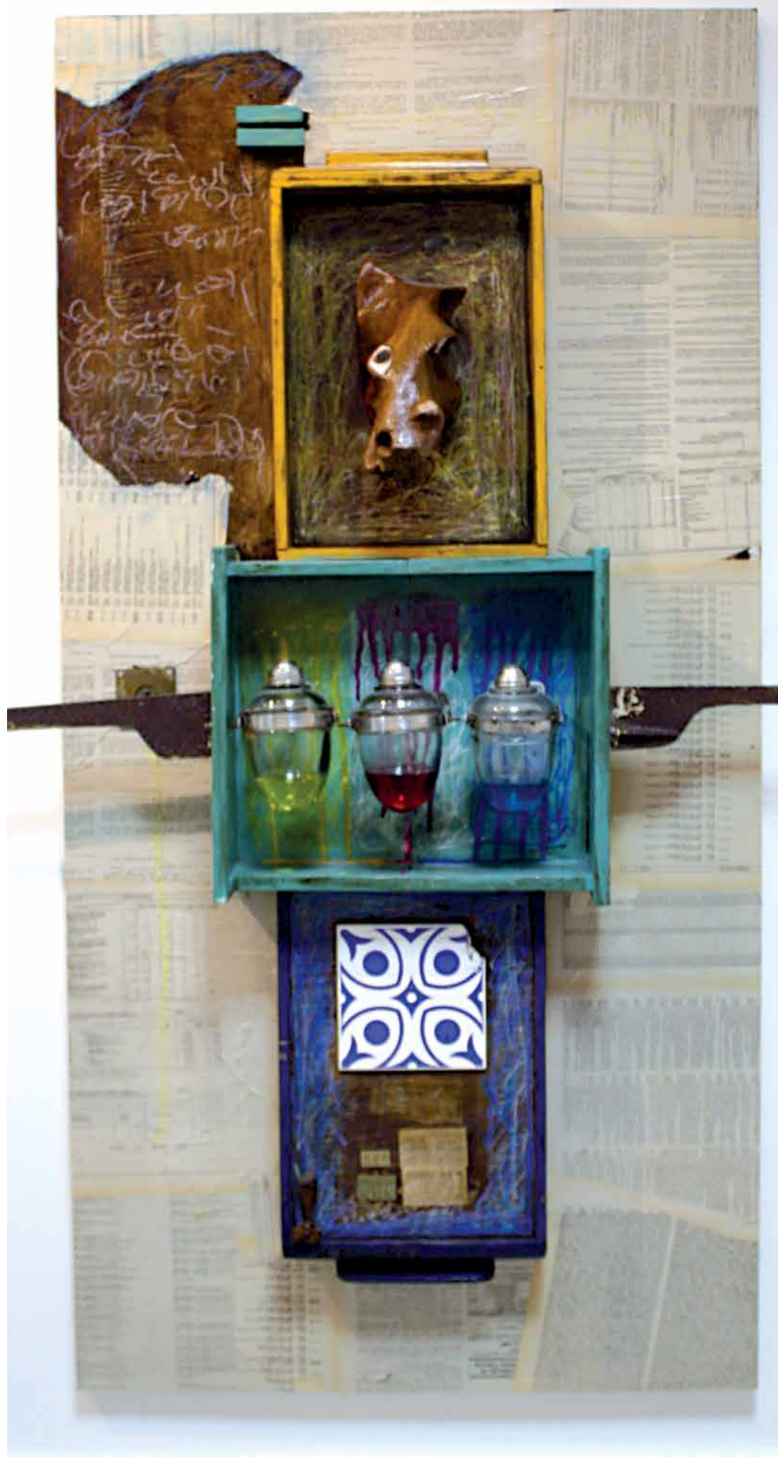
O artista utiliza diferentes objetos na composição dos seus painéis tridimensionais